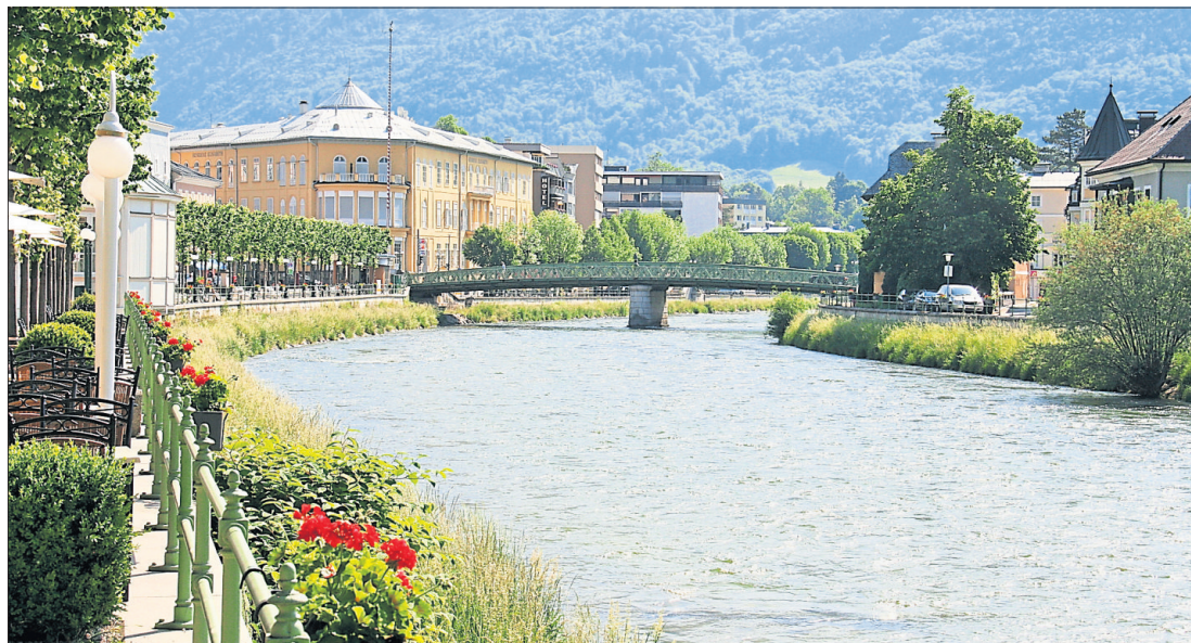
Die Esplanade in Bad Ischl: Promenieren und einkehren, etwa beim Zauner. Rechts: Aus der Kur-Apotheke ließ sich schon Sisi Haarwasser bringen.

In puncto Kulinarik hat das Städtchen zwischen Traun und Ischl einiges zu bieten: Auf dem Siriuskogel, einem Ausflugsziel seit 1865, beispielsweise kocht der junge Ischler Christoph Held Slowfood für Gäste, die leicht schnaufend auf dem Berg ankommen. Oft weht oben bei der Franz-Josefs-Warte ein sanftes Lüfterl, und dem Wanderer liegt die ehemalige Sommerfrischdestination des Kaisers buchstäblich zu Füßen, besonders schön bei Sonnenuntergang. Liebevoll hergerichtet sind die Veggie Burger mit hausgemachter Mayo, den Salatteller zieren essbare Blu-